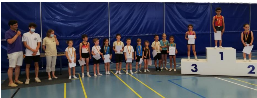
La catégorie des novices, les plus jeunes