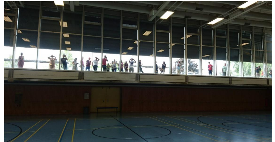
Les parents, qui ont assisté à la compétition derrière la vitre de la salle

Bravo et merci à tous : parents, enfants, bénévoles, juges et entraîneurs pour votre contribution à ce sympathique moment de sport enfin retrouvé en terre genevoise!